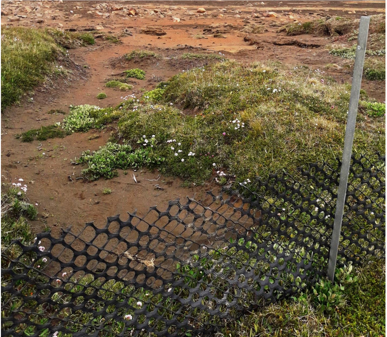
Mynd 5. Plastgirðing var sett þar sem hætta var á áfoki.