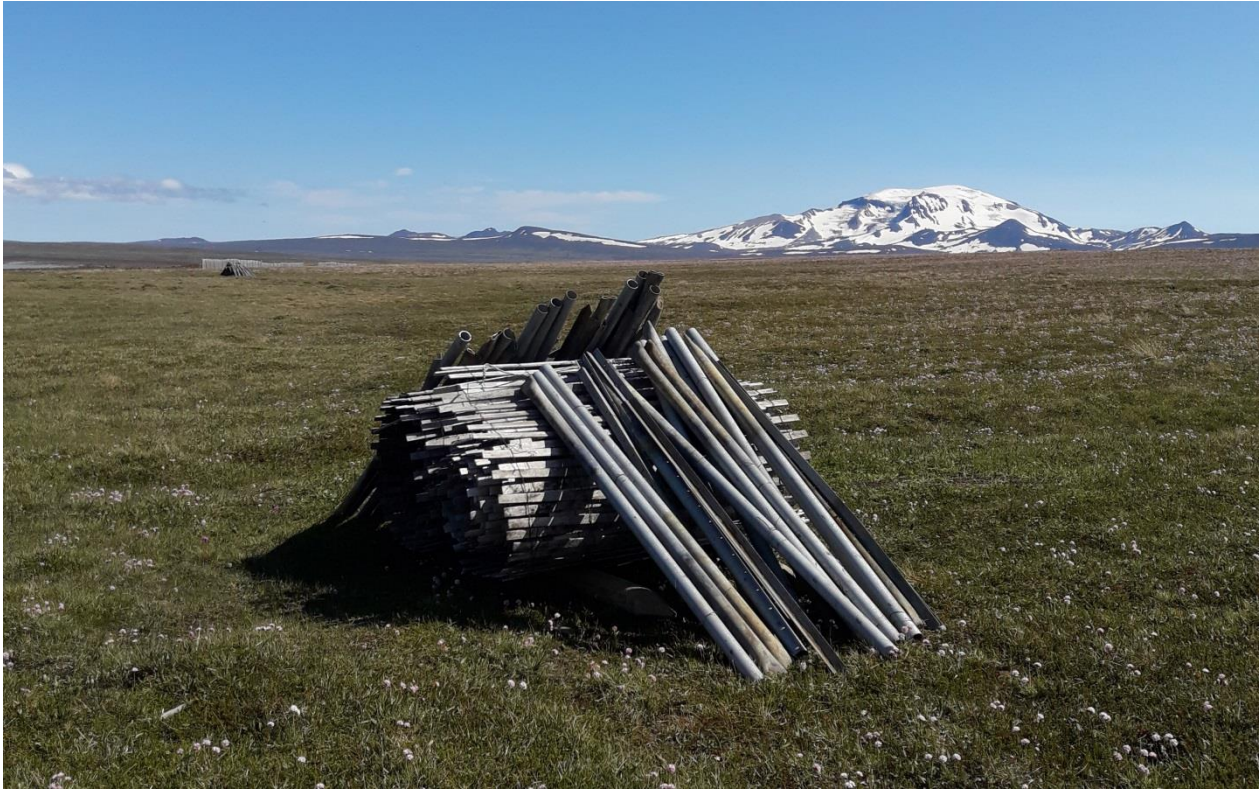
Mynd 12. Haгур númer 5