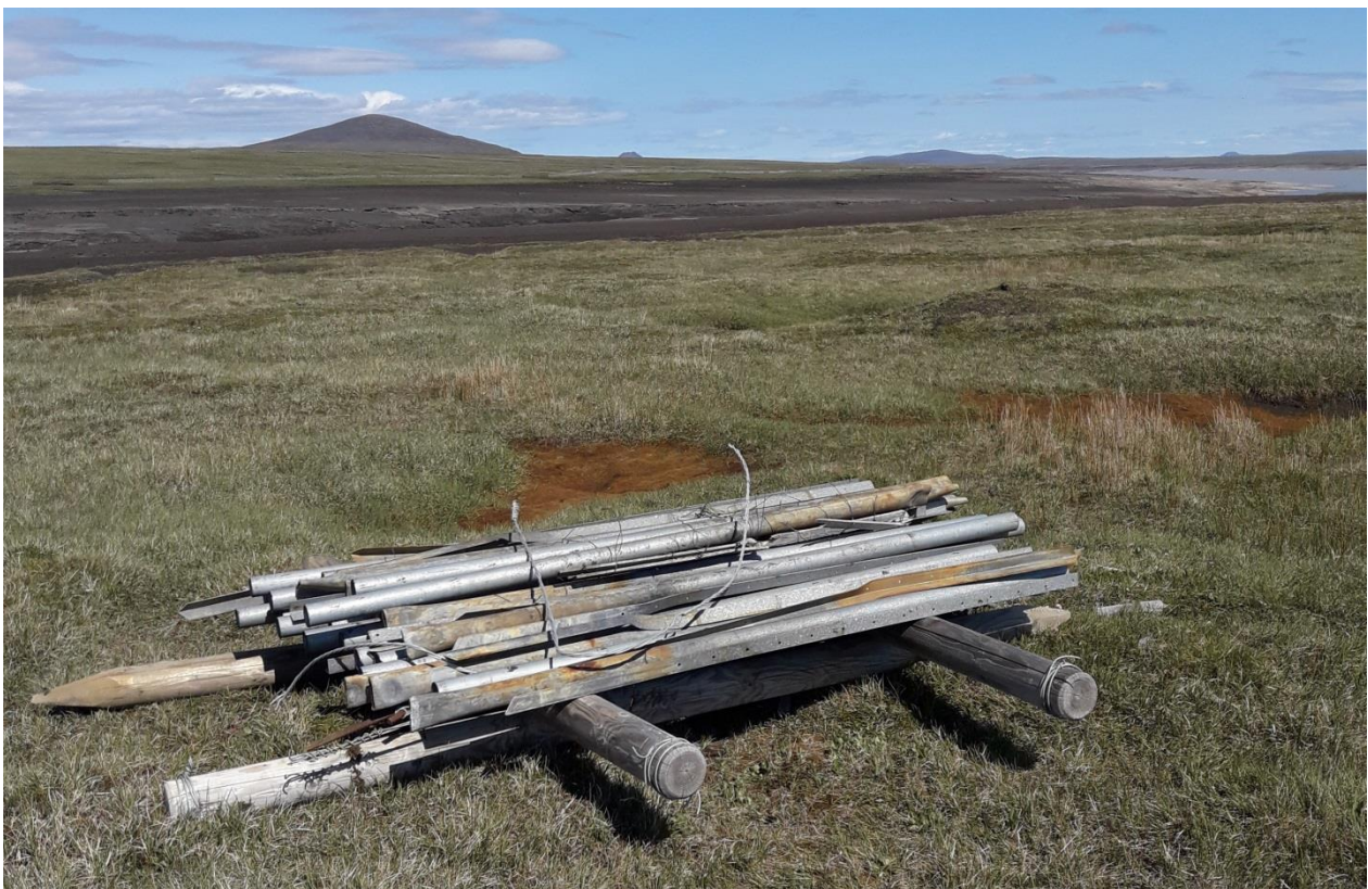
Mynd 9. Haгур нúmer 2