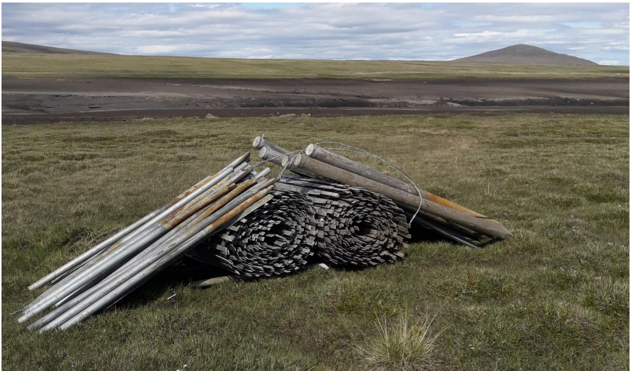
Mynd 13. Haгур númer 6