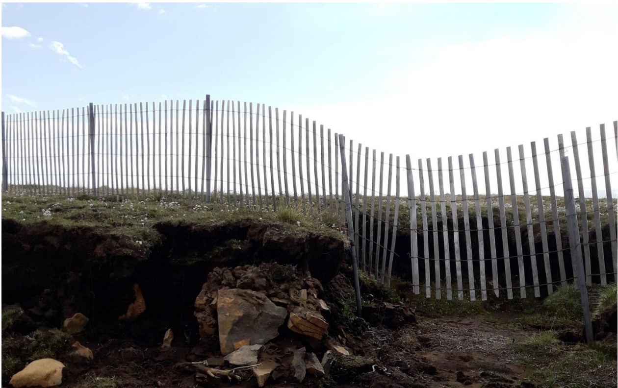
Mynd 1. Grafist hefur undan syðstu fokgirðingunni.

Farið varið var með fokgirðingum í Kringilsárrana og norðan Kringilsár og þær lagfærðar. Lítið þurfti að langfæra girðingarnar að undanskildum girðingum á norðausturhorni Kringilsárranans. Grafist hafði undan girðingunum á tveimur stöðum. Annarsvegar hafði grafist undan syðstu girðingunni (mynd 1) en hún var styttn sem því nemur og efnið úr henni sett í haug sem verður fjarlægður í vetur. Haugurinn er númer 9 á korti 1. Ekki þótti ástæða til að setja nýja girðingu í stað þeirrar sem fjarlægð var þar sem lónbakkinn er það hár á þessum stað að ekki eru líkur á að áfok verði úr lónstæðinu.