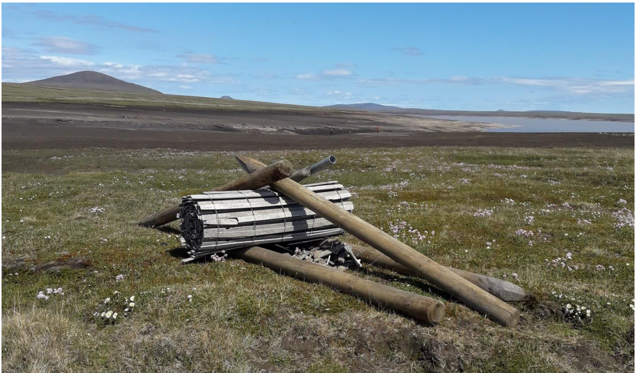
Mynd 11. Haгур нúmer 4