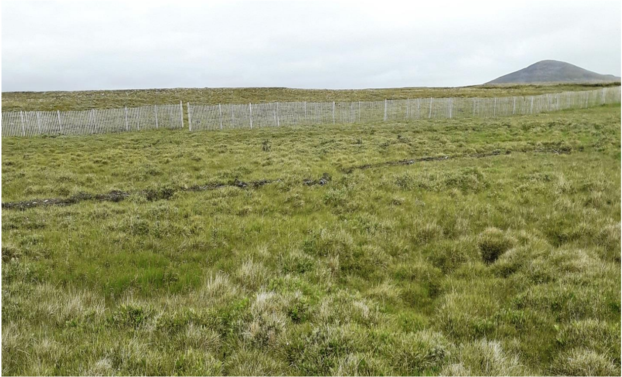
Mynd 7. Lónið gengur uppá gróið land í verstu veðrum.