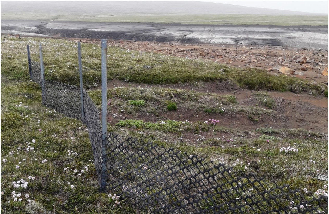
Mynd 4. Plastgirðing var sett við geil í lónbakkannum.

Plastgirðingar voru settar upp á tveimur öðrum stöðum í Rananum þar sem hætta var talin á að áfok yrði en á þessum stöðum voru geilar í lónbakkannum og sandurinn í lónstæðinu á því auðveldara með að fjúka uppá bakkann (myndir 4 og 5). Lítið sem ekkert áfok var á þessum stöðum.