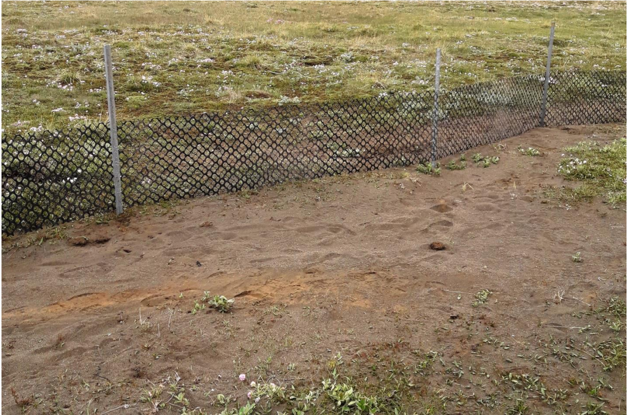
Mynd 3. Plastgirðing hefur verið sett upp til að stöðva áfok.