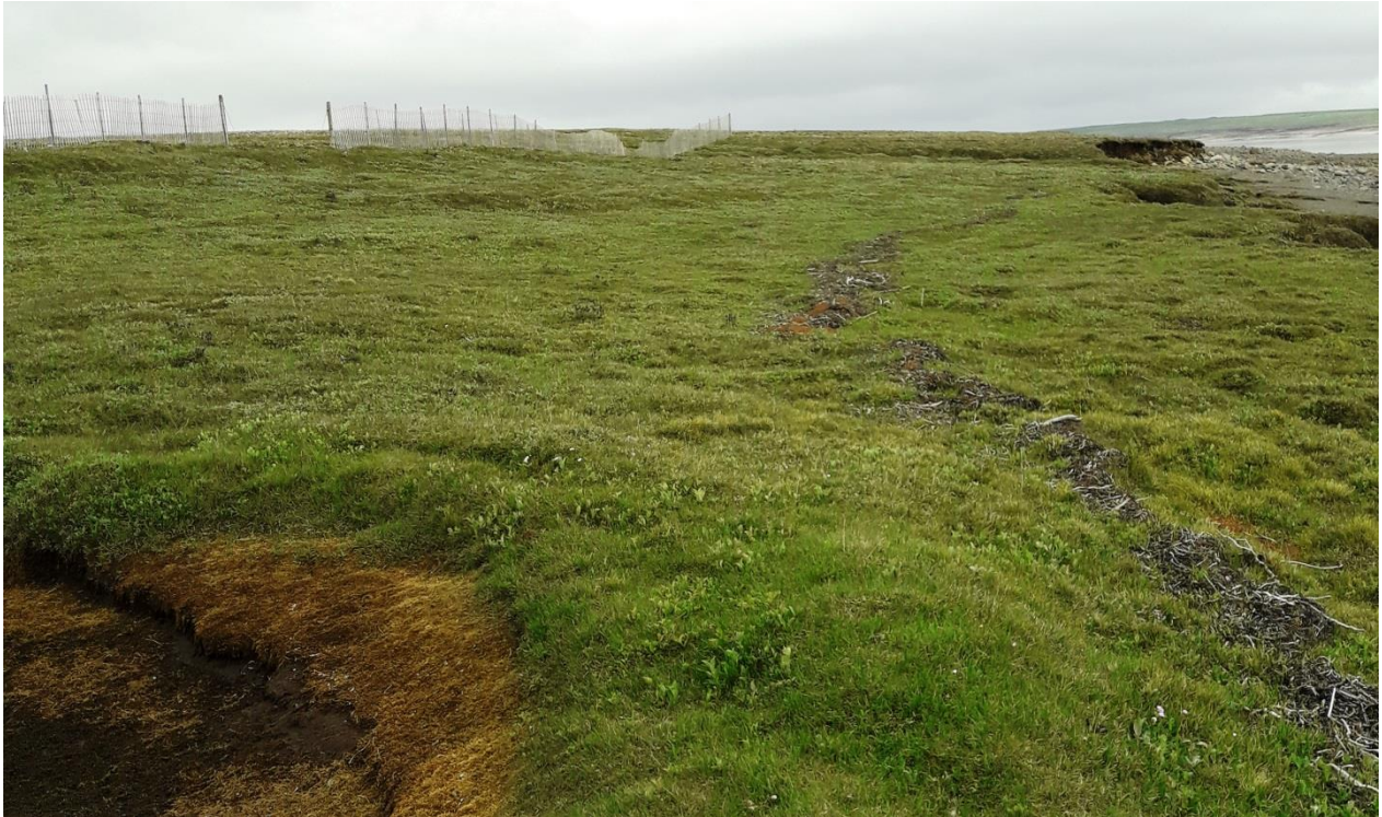
Mynd 6. Morið nær ekki að fokgirðingunum.

Farið var með fokgirðingum norðan Kringilsár og þær lagfærðar. Óverulegt áfok sást á tveimur stöðum en ekki þótti ástæða til að setja nýjar girðingar við það. Fokgirðingarnar eru talvert inná gróðurbakkanum og nær lónið ekki að þeim í verstu veðrum eins og sjást mátti á morinu sem situr eftir þegar lækkar í lóninu (myndir 6 og 7). Þar sem fokgirðingarnar standa talsvert ofan við strandlengju Háslóns og landhalli er það mikill að lónið nær ekki í efstu stöðu að þeim, auk þess sem áfok er varla teljanlegt þykir ekki ástæða til þess að fokgirðingarnar standi lengur. Lagt er til að þær verði fjarlægðar áður en það fer að koma að viðhaldi á þeim sökum aldurs.