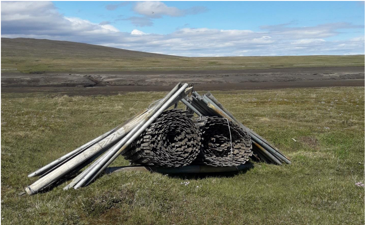
Mynd 10. Haгур нúmer 3