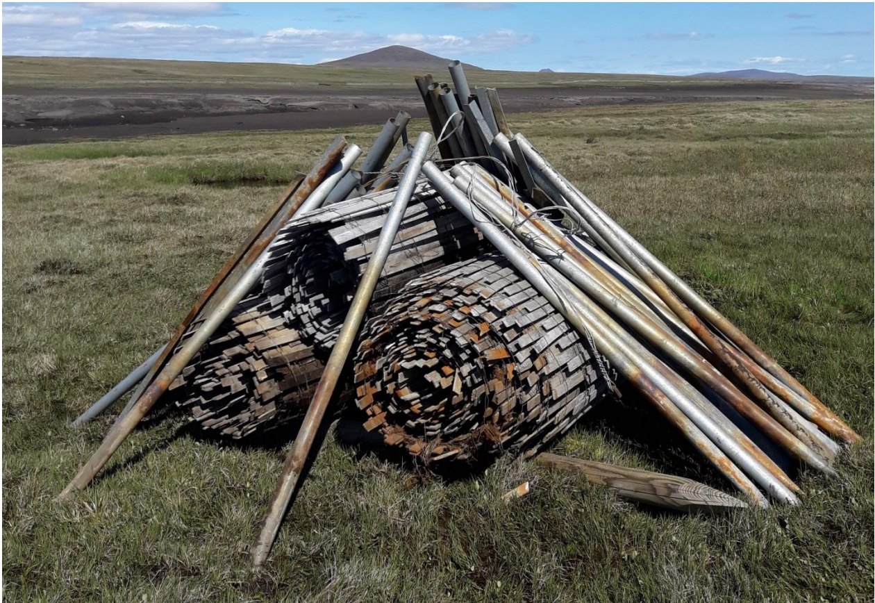
Mynd 8. Haгур нúmer 1