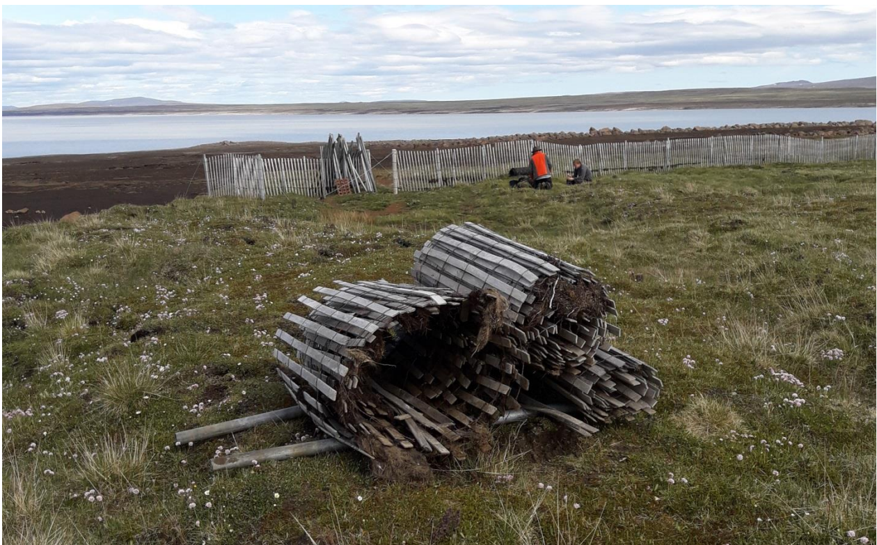
Mynd 15. Haгур нýмер 8