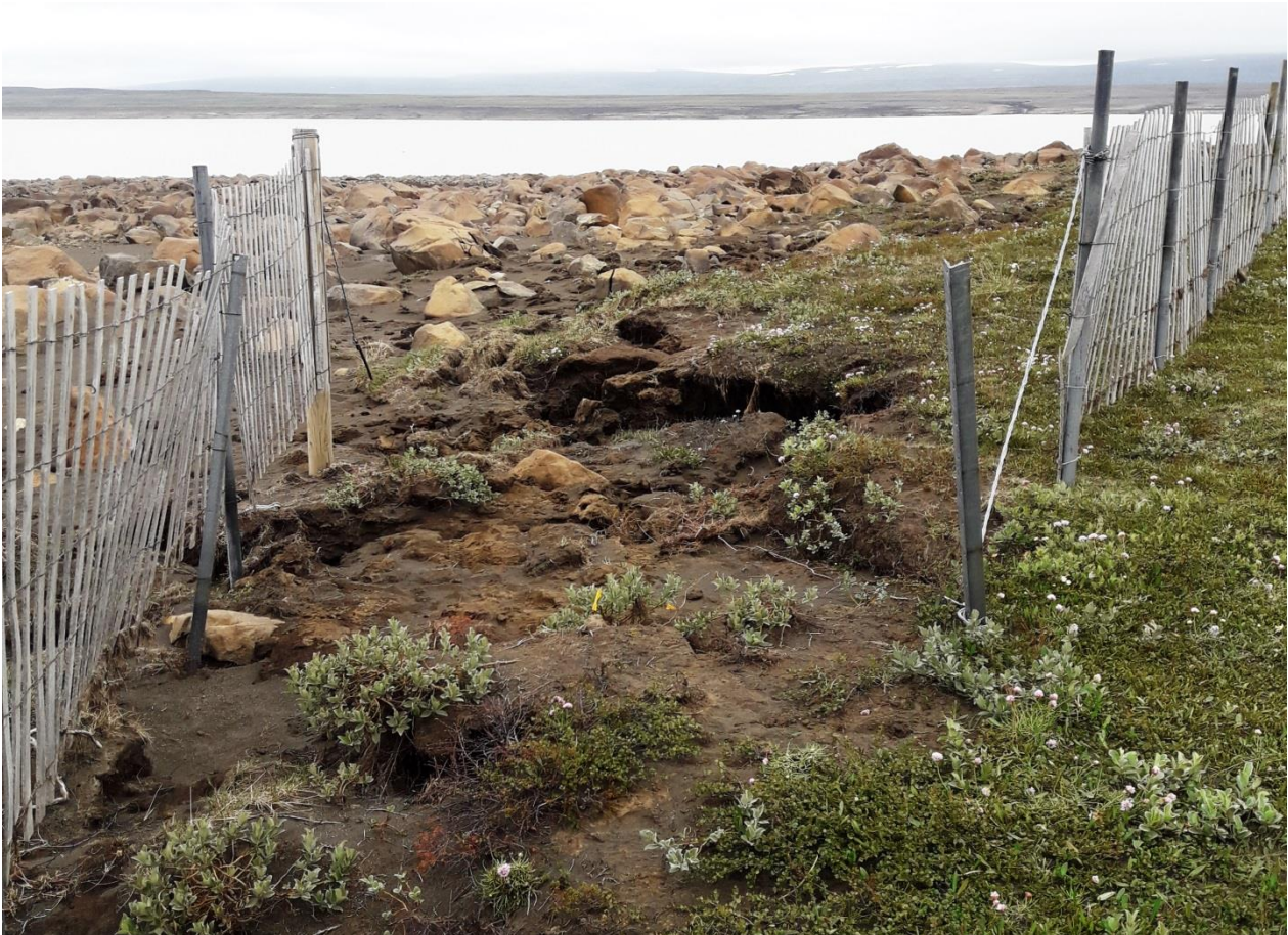
Mynd 2. Fokgirðing vinstra megin á myndinni hefur verið færð uppá bakkann.

Hins vegar hafði líka grafist undan hluta fyrstu girðingarinnar sem liggur í vestur á norðausturhorni Ranans (mynd 2). Var sá hluti girðingarinnar færður úr lónstæðinu og settur niður uppá lónbakkannum. Á þessum stað er lítilsháttar áfok og var því lág plastgirðing sett upp til að stöðva það (mynd 3). Plastgirðingin er rauðmerkt á korti 1 og er hún austasta rauða girðingin á loftmyndinni.