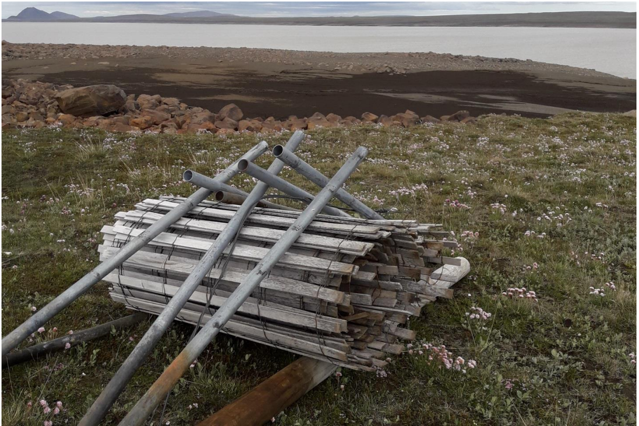
Mynd 16. Haugur númer 9