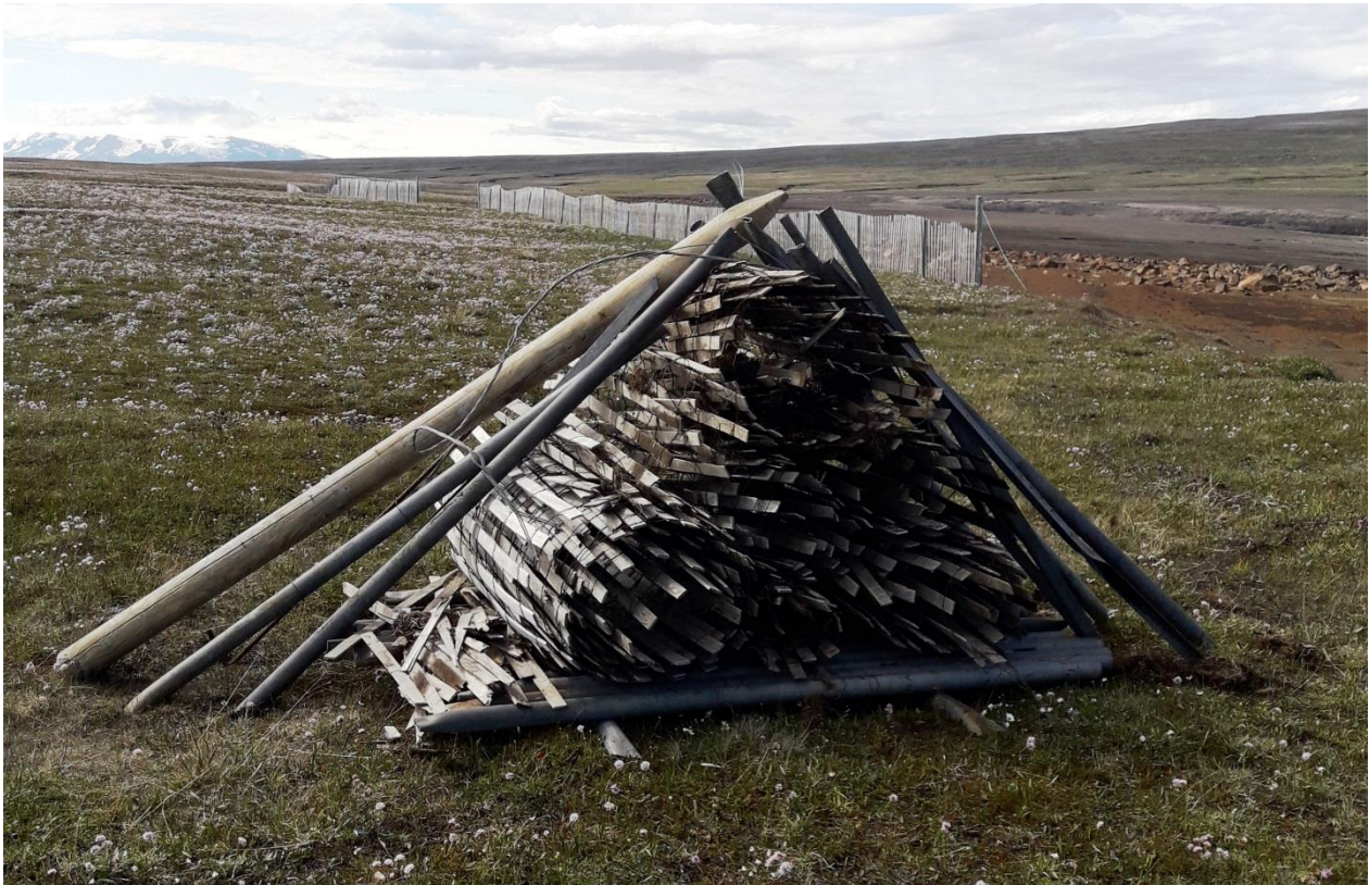
Mynd 14. Haгур нýмер 7