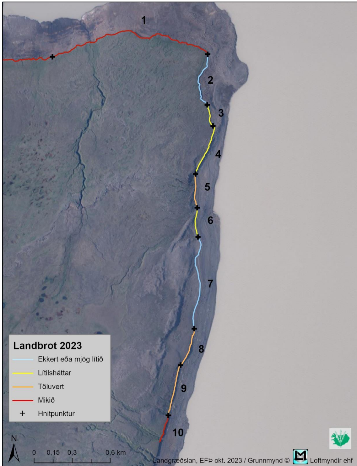
Kort 4. Landbrot við norðurodda Kringilsárrana skv. úttekt sumarið 2023.

Á nyrsta kafla þessa svæðis (lína nr.1) hefur hraði landbrots verði mikill undanfarin ár og er ekki breyting þar á þetta árið. Suður með austurbakkanum hefur landbrot haldið áfram á línunum 5, 6, 8, 9 og 10 frá fyrra ári.