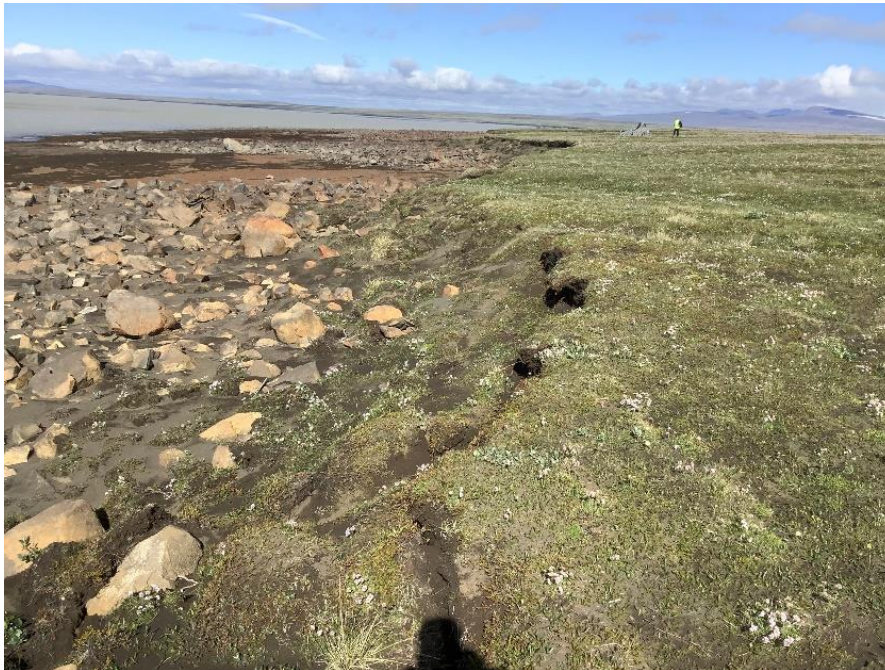
Gróinn bakki rofinn – mikið rof (lína1).

Ljósmyndir sem sýna dæmi um bakkagerð og landbrot á korti 4.