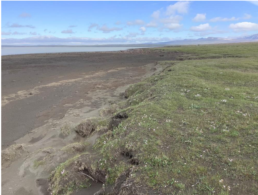
Gróinn bakki rofinn – töluvert landbrot (lína 1).

Ljósmyndir sem sýna dæmi um bakkagerð og landbrot á korti 3.