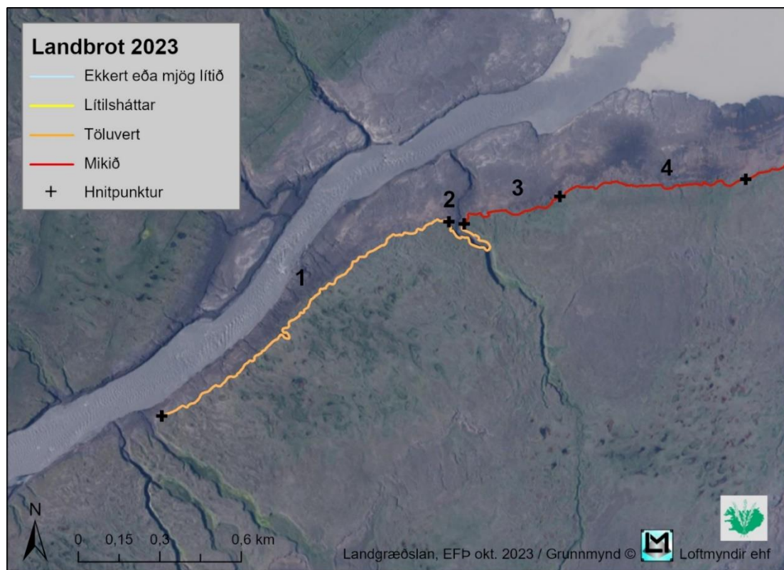
Kort 3. Landbrot við Kringilsá skv. úttekt sumarið 2023.

Mikil breyting varð á þessu svæði milli árána 2018 og 2019 þegar landbrot jókst á svæðinu og sú þróun hélt áfram árin 2020 til 2022. Landbrot milli árána 2022-2023 mælist minna en árin á undan, sem getur helgast af hagstæðu veðurfari. Er það mat okkar að svo sé fremur en að einhverju jafnvægi sé náð, tíminn mun þó leiða það í ljós.