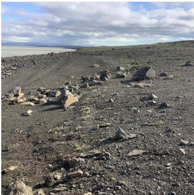
Malarströnd – mjög lítið landbrot (lína 7)