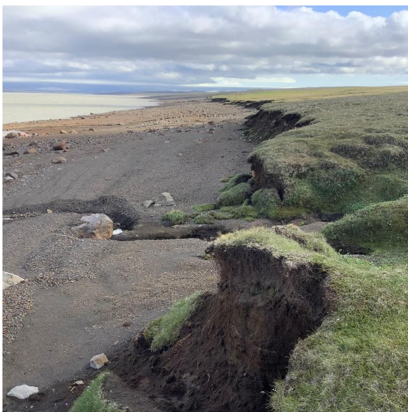
Gróinn bakki rofinn – mikið rof (lína10).