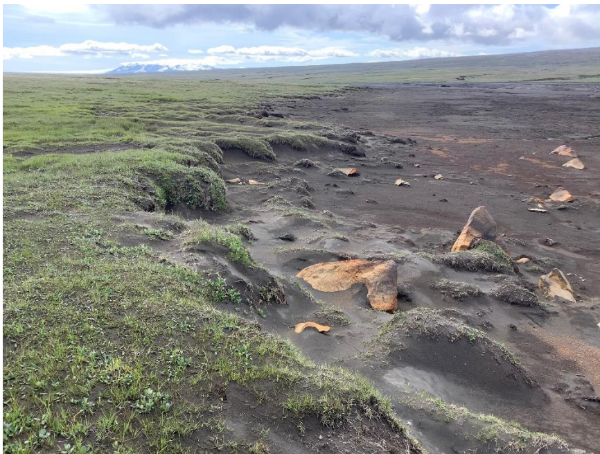
Gróinn bakki rofinn – mikið landbrot (lína 3).