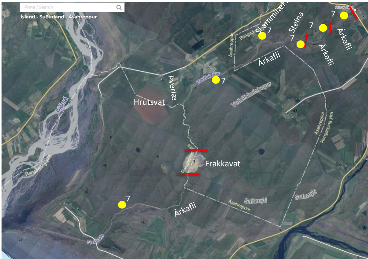
Mynd 1. Yfirlitsmynd yfir Rauðalæk neðan Hringvegur og nánasta umhverfi. Inn á myndina eru merkt skil milli árkafla í búsvæðamati (rauð strik) og staðsetning rafveiðistöðva (gulir hringir). Figure 1. Overview of river Rauðalækur below Ringroad nr. 1 and the surrounding area. The illustration shows numbered river-sections (0 – 3) in the habitat assessment (red lines) and the location of electrofishing stations (yellow circles).