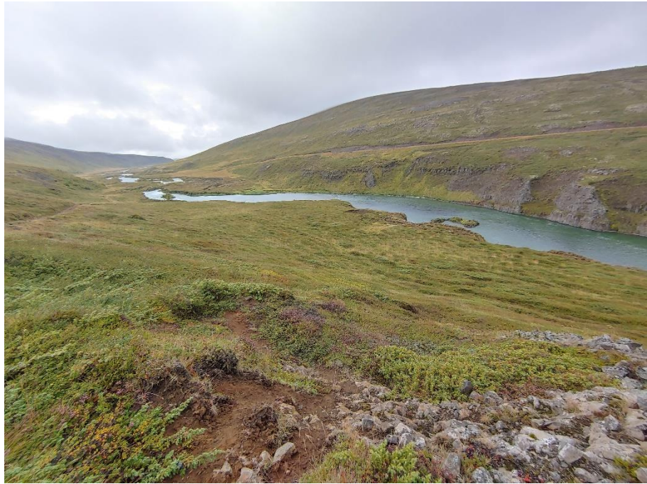
Mynd 4. Hveitibrauðsgötur [3105-4] liggja frá miðri mynd til hægri og suður með ánni. Horft til suðvesturs.

Í örnefnaskrá segir: „Upp af stíflunni er Hveitibrauðshvammur (30). Um hann liggur gata, sem Laxdælir fóru um, þegar þeir fóru lestarferðir til Húsavíkur. Eitt sinn misstu þeir hveitisekk af hesti í hvammi, og hlaut hann nafn sitt af þessum atburði.“ (bls. 2). Í fornleifaskráningu frá 2003 segir: „SP-228:010 heimild um leið 65°48.680N 17°17.786V [...] Þær eru greinilegar í hvamminum upp af Eiríkseyjum. Göturnar eru greinilegastar í Hveitibrauðshvamminum. Hann er nokkuð sléttur og lyngivaxinn. Nokkrir samsíða slóðar í lyngivöxnum móa. Göturnar verða ógreinilegri eftir því sem nær sunnar dregur. Þegar komið er til móts við Eiríksvað (020) eru þær orðnar alveg ógreinilegar. og ekki er hægt að greina þær síðasta spottann að ánni.