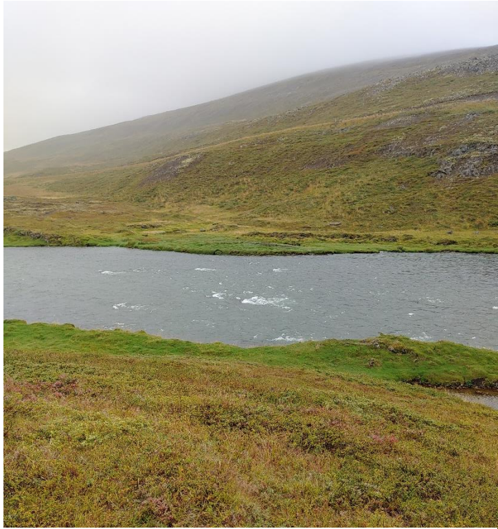
Mynd 7. Eiríksvað [3105-7]. Horf til suðvesturs.

Nákvæm staðsetning vaðsins er ekki þekkt en það var skráð á sama stað og í fornleifaskráningu 2004 (Elín Ósk Hreiðarsdóttir og Birna Lárusdóttir 2003). Þar er áin breið og