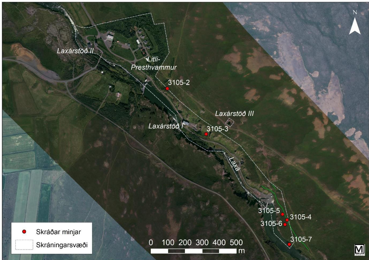
Mynd 1. Yfirlitskort af skráningarsvæði. Kortagerð: Bryndís Zoëga, lofmynd frá verkkaupa.