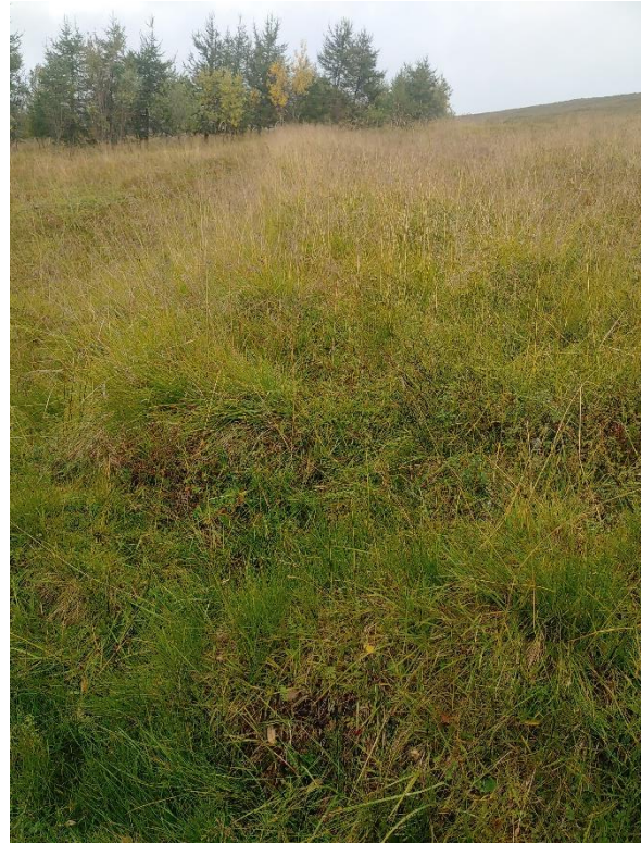
Mynd 2. Garðlag [3105-2]. Horft út fyrir skráningarsvæðið til norðurs.

Garðlagið sést vel ofan girðingar en er horfið í gróður neðan girðingar. Skráningarsvæðið er neðan girðingar en punktur var tekinn við girðinguna þar sem ljóst er að garðurinn nær inn á skráningarsvæðið þótt hann sjáist ekki. Garðurinn sést m.a. á loftmynd frá 1955 (LMI-Kort-LI209-L12-1932). Utan skráningarsvæðisins er garðurinn breiður, um 2 m á breidd, siginn og gróinn. Mest er hann um 50 cm hár. Ekki sést í grjóti.