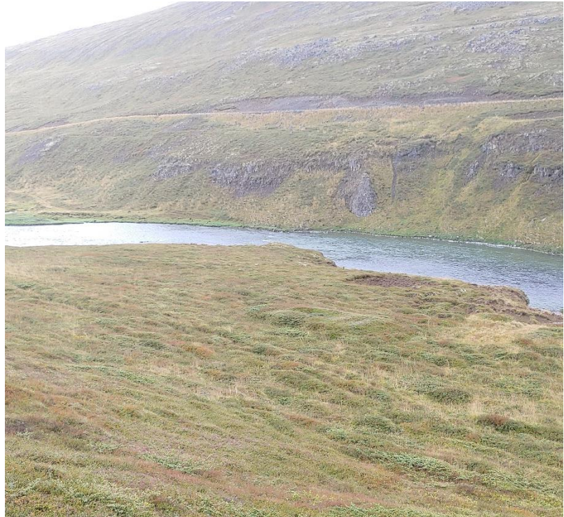
Mynd 5. Tóft [3105-5] rétt neðan við miðja mynd. Hveitibrauðsgötur [3105-4] framan við tóftina. Horft til suðvesturs.

Tóftin er stór og ílöng, virðist þriggja hólfa, og liggur NNV-SSA. Utanmál er um 16x6,5