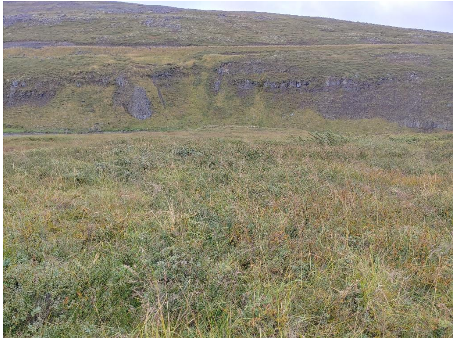
Mynd 6. Tóft [3105-6]. Horft til vesturs.

Fast vestan við Hveitibrauðsgötur, ofan Laxár, um 150 m suðaustan stíflu, er tóft í lyngi- og kjarrivöxnum móum. Um 45 m suður af tóft [3105-5].